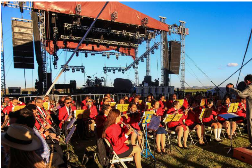
Figure 9. Tierra Adentro Wine Festival 2018