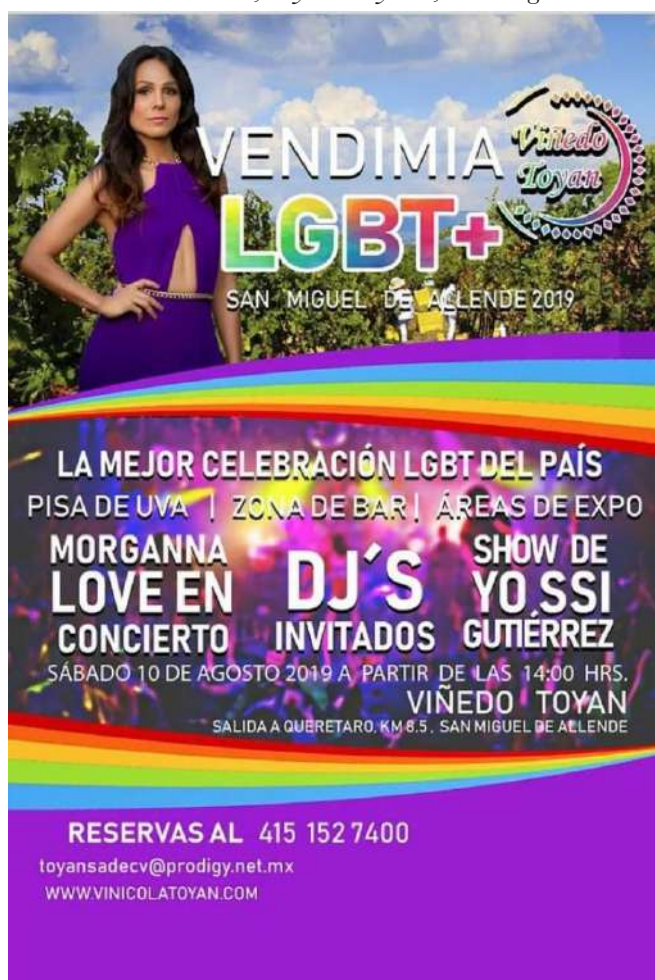
Figura 6. Vendimia LGBT+, Viñedos Toyan, San Miguel de Allende, México Figure 6. LGBT + Wine Festival, Toyan vineyards, San Miguel de Allende, Mexico

Ciertamente, las formas en que se van complejizando las expresiones de la vendimia en México parten de un principio organizador, basado en la hibridación cultural (García-Canciani, 1990). Sin embargo, ello solo es parte de una teatralización sofisticada que requiere múltiples elementos, tomados en préstamo de diversos grupos sociales que no necesariamente están invitados a la fiesta (Más de Acá, 2019), tal como certifican los precios de acceso a estos eventos, cuyo promedio oscila en cien dólares americanos, algo no permitido para la inmensa mayoría de habitantes.