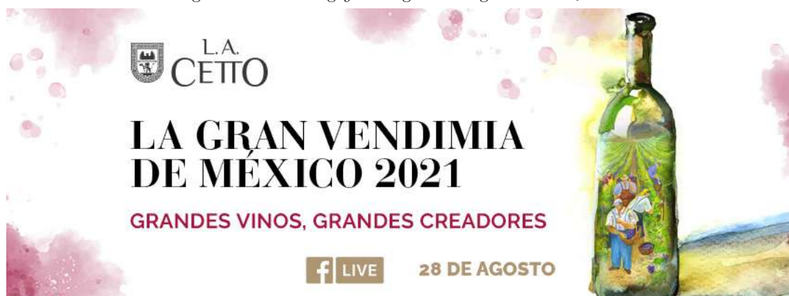
Figure 10. Advertising of the Digital Vintage L.A. Cetto, 2021