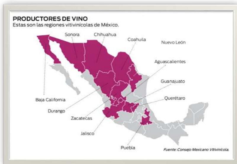
Figure 2. Wine regions of Mexico