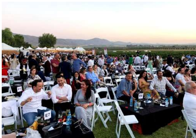
Figure 5. Vintage 2019 Monte Xanic