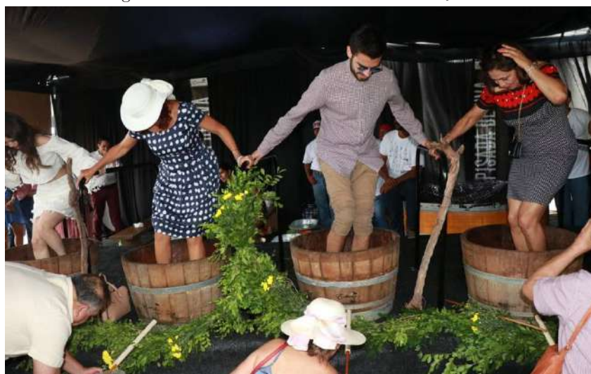
Figure 7. Harvest Festival Hacienda Encinillas, 2019