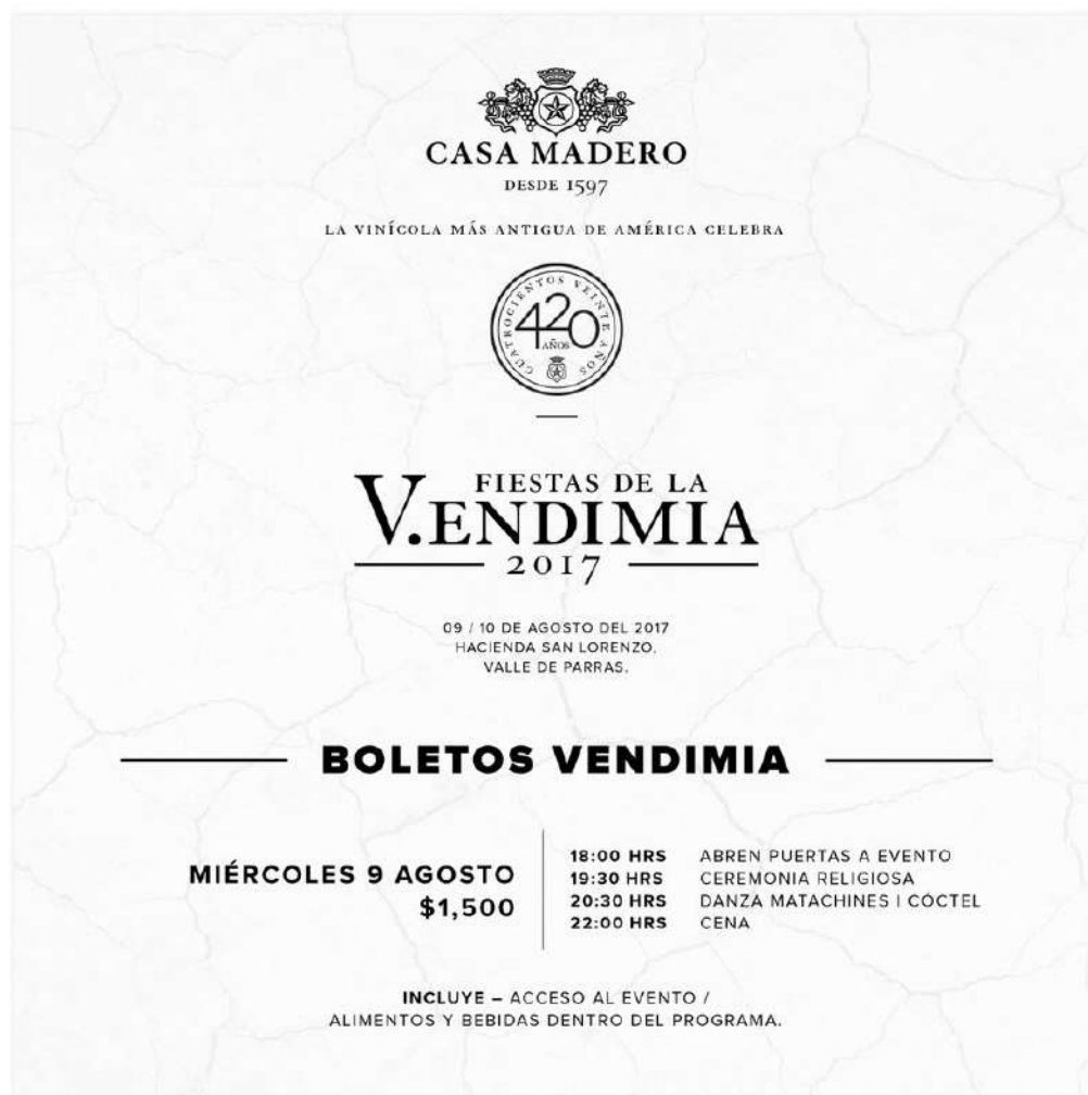
Figura 3. Evento privado en Vendimia Casa Madero, 2017 Figure 3. Private event at the Casa Madero Festival, 2017