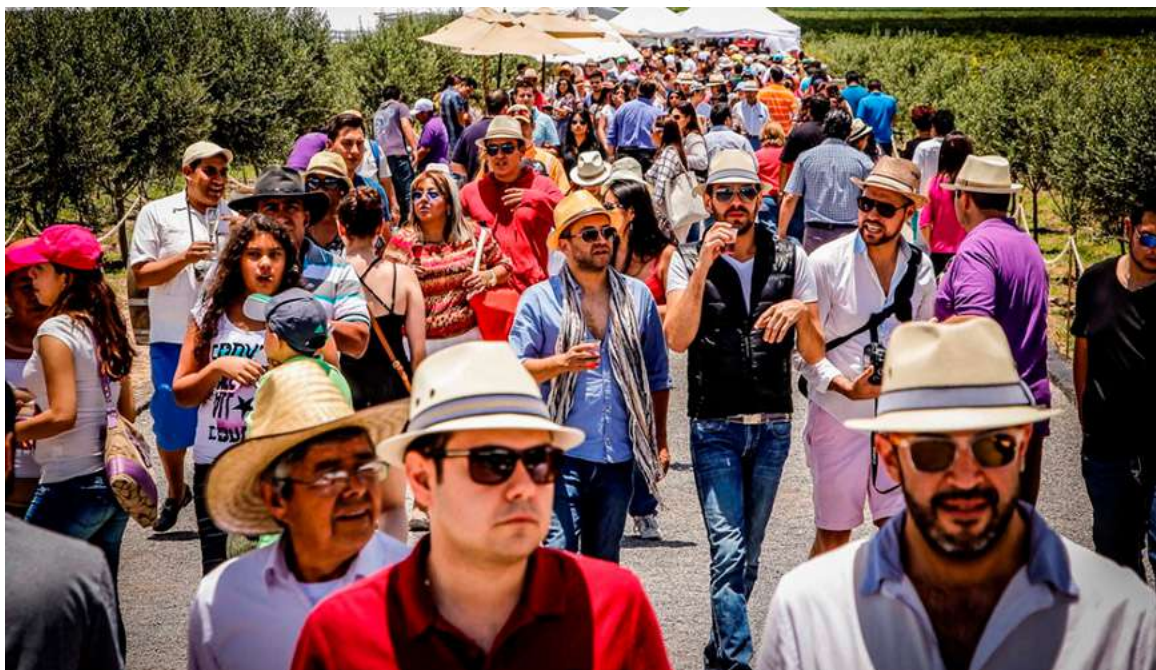
Figure 4. 2015 Freixenet Festival, Querétaro, Mexico