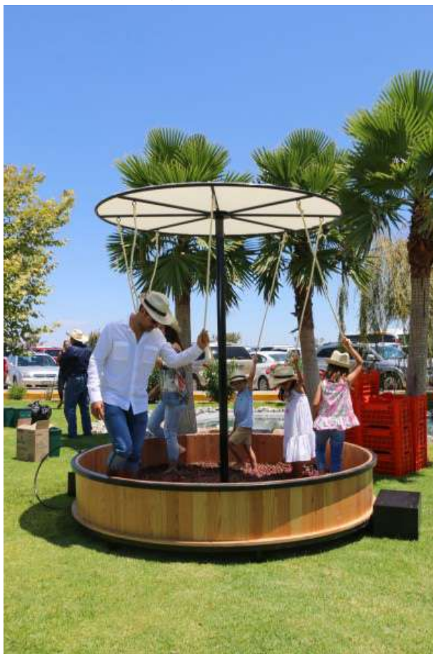
Figure 8. Cava Quintanilla Wine Festival, 2018