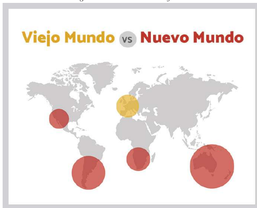
Figure 1. New and Old World of Wine